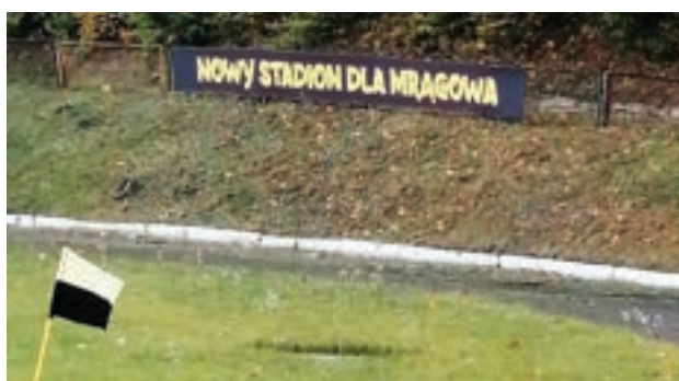
Piłkarze i działacze klubu oraz kibice marzą o nowym stadionie od dawna.

Stadion będzie dostosowany do wymagań Polskiego Związ-