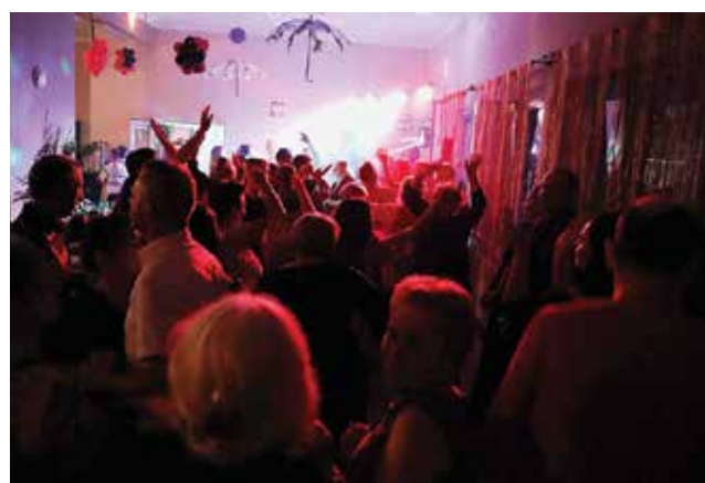
Zabawa trwała do późnej nocy