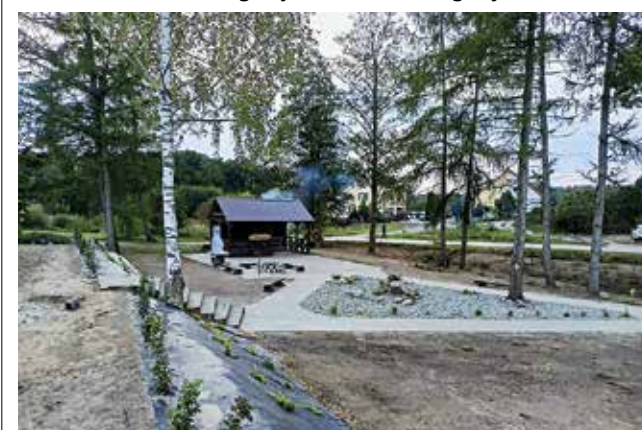
Miejsce rekreacyjne w Zgodzie

W Zgodzie odbył się festyn sołecki, podczas którego mieszkańcy świętowali uroczyste otwarcie miejsca rekreacyjnego.