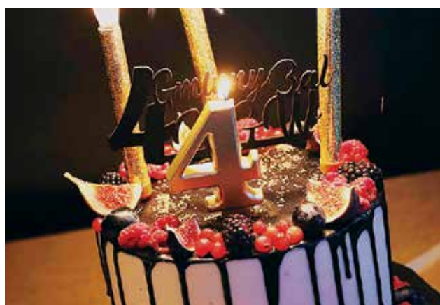
Tort okolicznościowy przygotowany specjalnie na bal

Spotkały się tutaj panie, które na co dzień działają w swoim KGW na terenie gminy Braniewo. W tym roku wyjątkowo na balu bawiły się przedstawicielki aż dwunastu kół: gospodarze – KGW „Warmianki” z Żelaznej Góry, KGW „Nasze Krzewno” z Krzewna, KGW „Szylenianki” z Szylen, KGW „To My” z Lipowiny, KGW „Szlachcianki na obcasach” z Rogit, KGW „Zgodni” w Rusach, KGW „Podlesianki” z Podlesne, KGW „Pod prosiaczką” z Rudłowa, KGW w Brzeszynie, KGW „Maciejki” z Maciejewa,