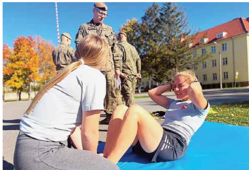
Pierwszy dzień za bramą jednostki – sprawdzian kondycji fizycznej; będzie powtarzany każdego roku służby

Podstawowe, 16-dniowe szkolenie odbywało się w obiektach i na terenie 43 batalionu lekkiej piechoty w Braniewie. Żołnierze rozpoczęli je 7 października. Przysięgę złożyli 22 października. Teraz przed nimi 3 lata dalszych szkoleń: indywidualne, specjalistyczne i zgrzywające pododdziały. Nowi żołnierze zasilili bataliony w Braniewie, Olsztynie, Morągu, Giżycku i Elku.