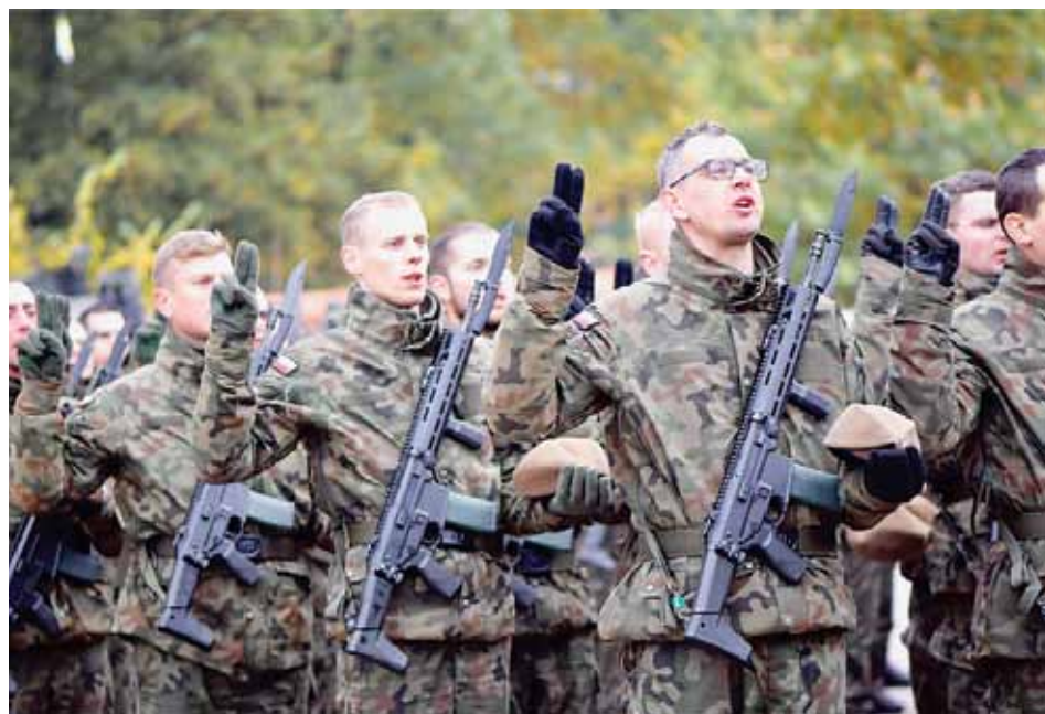
Przysięga to uroczysty, najważniejszy dzień w życiu każdego żołnierza

Niemal 90 żołnierzy wypowiedziało słowa przysięgi na placu przed braniewską bazyliką. W ten uroczysty sposób zakończyli swoje szkolenie podstawowe, które odbywali w kompanii szkolnej 4 Warmińsko-Mazurskiej Brygady Obrony Terytorialnej.