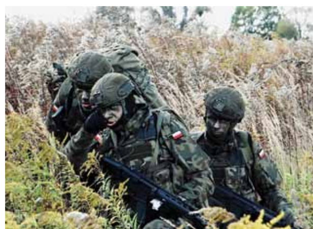
To dowódca sekcji decyduje o tym, jakie działania podejmą jego żołnierze; to on wydaje komendę „za mną”

na. Posługiwanie się bronią, strzelanie, zakładanie maski przeciwgazowej i jej właściwe użycie, poruszanie się w terenie z wykorzystaniem busoli, czy udzielanie pomocy medycznej na polu walki – to tylko niektóre zadania, jakie musieli wykonać żołnierze. Jest to eg-