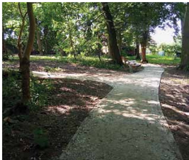
Wasserfall Parkschloß Regitten