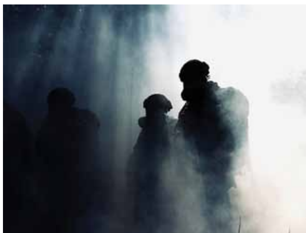
Pętla taktyczna jest wymagająca – trzeba zaufać nie tylko kolegom z sekcji, ale także sprzętowi – np. maskom p.gaz.

reagowania na kontakt z przeciwnikiem, wyznaczanie kierunku marszu i dobrej orientacji w terenie. Tych wszystkich zasad nowych żołnierzy uczyli instruktorzy z kompanii szkolnej 4W-MBOT.