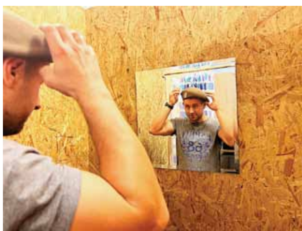
Nie każdy może nosić oliwkowy beret, wymaga to wielu poświęceń

Równie ważne są umiejętności poruszania się w terenie,