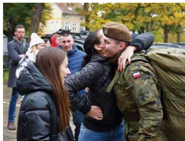
Śczęśliwy moment – powrót do domu, do bliskich, już jako żołnierz

zamin nie tylko sprawdzający wiedzę nowych terytorialsów, ale również test na ich umiejętność działania w zespole.