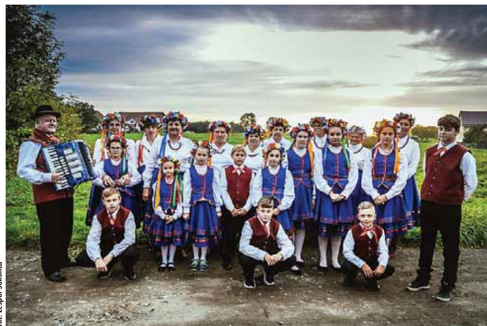
fol. zespół Sokolica

11 listopada mieszkańcy Kętrzyna mają potrójną okazję do świętowania. Jednocześnie obchodzą bowiem Narodowe Święto Niepodległości, rocznicę nadania praw miejskich oraz Dzień św. Marcina – przy okazji którego organizowane są mazurskie morcinki.