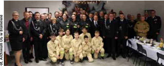
Takie spotkania nie tylko podkreślają znaczenie tradycji, ale także budują więzi między członkami społeczności strażackiej

Tradycją w Gminie Braniewo jest doroczne spotkanie opłatkowe organizowane przez Zarząd Gminny ZOSP RP w Braniewie. W tym roku gospodarzami uroczystości było OSP Gronowo.