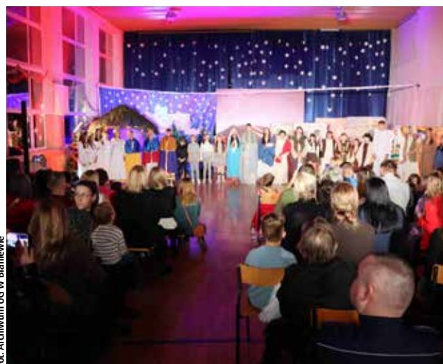
W jasełkach wystąpili uczniowie ze Szkoły Podstawowej w Lipowinie