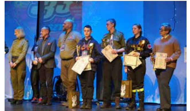
Uroczyste wręczenie pucharów dla uczestników rajdu pieszego „Pierwsza Pomoc”

Rajd nie tylko promował aktywność fizyczną, ale również dostarczył uczestnikom niezapomnianych wrażeń i wyzwań, łącząc sport, naukę oraz dobrą zabawę, pogłębił również wie-