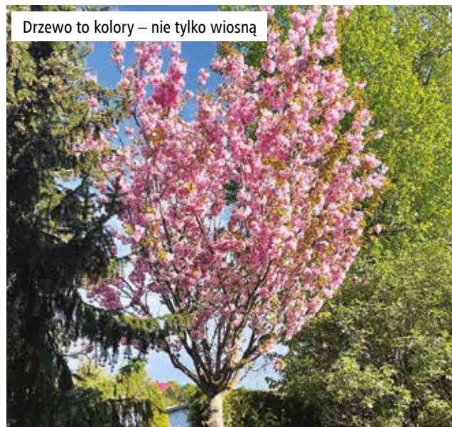
Drzewo to kolory – nie tylko wiosną

sto tańsze niż z doniczki a te z gołym korzeniem są lżejsze i łatwiejsze w transporcie. W miesiącach późnowiosennych i letnich możemy sadzić drzewa produkowane w pojemnikach. Wybór jest ogromny! Jeżeli nie mamy miejsca na rozłożystą koronę – wybierzmy formy kolumnowe: np. grab „Fastigita” lub dąb „Green Pillar”. W małym ogrodzie możemy posadzić formy płaczące: np. brzozę „Youngii” lub wiąz „Camperownii”.