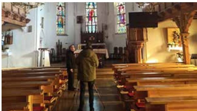
Dokumentowanie witraży w kościele św. Stanisława Kostki w Karolewie.

Projekt zakłada prezentację działalności dziewiętnasto- i dwudziestowiecznych niemieckich pracowni witrażowych oraz zachowanych do czasów współczesnych realizacji tych pracowni z terenu dawnych Prus Wschodnich. Zaprezentowane zostaną witraże zarówno te, które wykonane zostały do wnętrza kościel-