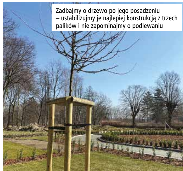
Zadbajmy o drzewo po jego posadzeniu – ustabilizujmy je najlepiej konstrukcją z trzech palików i nie zapominajmy o podlewaniu