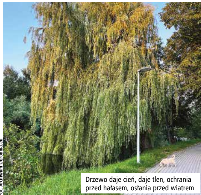
Drzewo daje cień, daje tlen, ochrania przed hałasem, osłania przed wiatrem

Coś się jednak zmienia. Małymi krokami przychodzi zmiany. Przynajmniej w ogro-