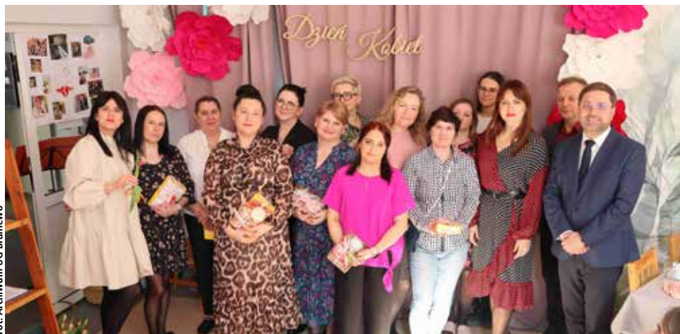
Wspólna fotografia pań – w dniu ich wyjątkowego święta

Dzień Kobiet, obchodzony w Środowiskowym Domu Samopomocy w Żelaznej Górze, był wyjątkową okazją, aby uczcić wszystkie panie.