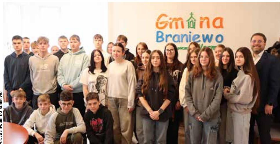
A na zakończenie spotkania w urzędzie gminy zrobiono sobie pamiątkową fotografię