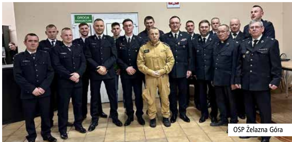
OSP Żelazna Góra