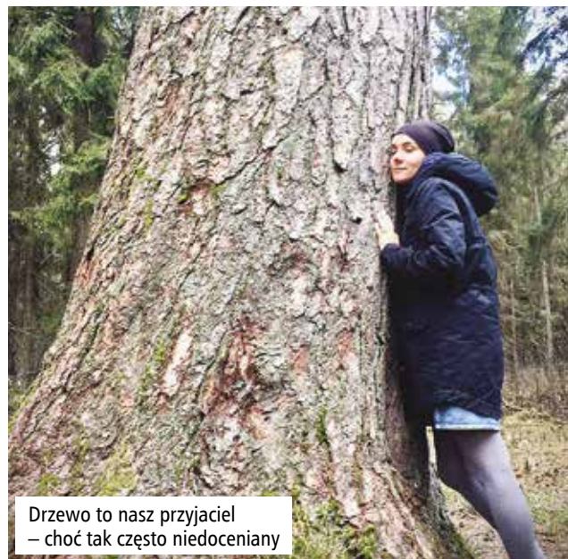
Drzewo to nasz przyjaciel – choć tak często niedoceniany