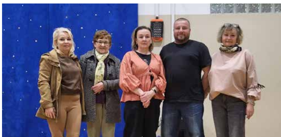
Przedstawiciele sołectwa Pieniężno Stare Wewno