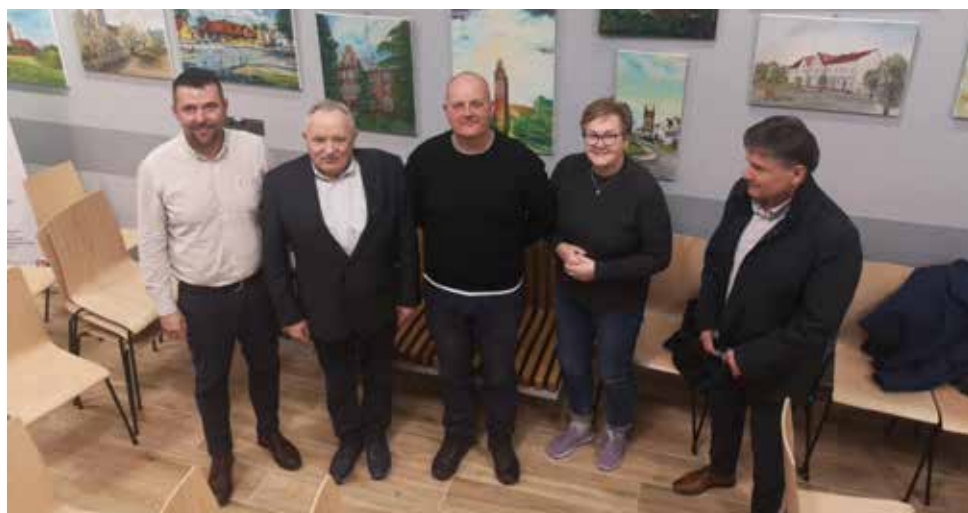
Reprezentacja sołectwa Pieniężno Nowe Wewno