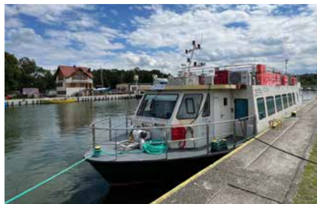
Statkiem „Zefir” popłyniemy z Tolkmicka do Krynicy Morskiej

Między 5 maja a 13 czerwca (czyli od końca majówki do Bożego Ciała) rejsy z Fromborka