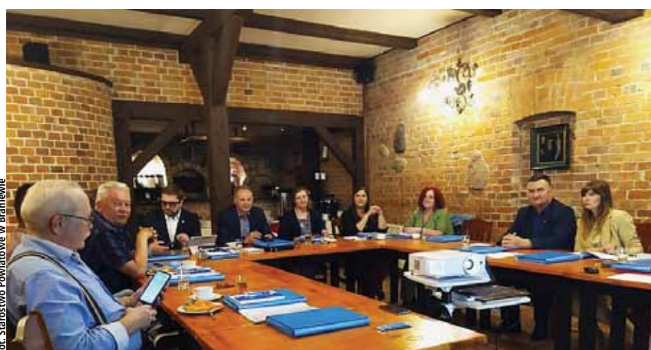
Inf. prasowa Starostwa Powiatowego w Braniewie

Tematem spotkania były nowe regulacje prawne dotyczące dopuszczenia cudzoziemców do rynku pracy ze szczególnym uwzględnieniem obywateli Ukrainy