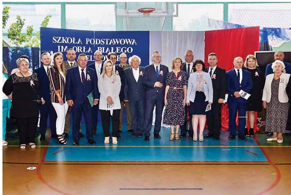
Z okazji nadania szkole imienia i wręczenia sztandaru w placówce gościło wielu znamienitych gości

Szkoła Podstawowa w Lelkowie otrzymała imię Orła Białego. To nawiązanie do tradycji zlikwidowanego przed kilkoma laty gimnazjum. Do placówki trafił także nowy sztandar.