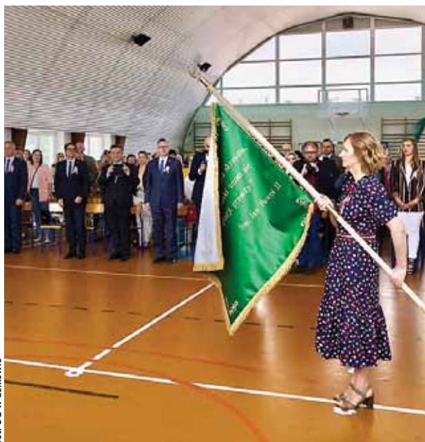
Nowy sztandar będzie na co dzień eksponowany w gablocie przekazanej szkole przez Gminę Lelkowo