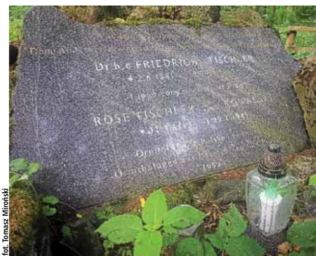
Tischlerom pomnik ufundowali polscy i niemieccy ornitolodzy w 1999 roku

Nagle ich cały świat legł w gruzach. W styczniu 1945 roku rozpoczął się podbój Prus Wschodnich przez Rosjan. To był krwawy i niszczyielski czas. Region zaatakowały wojska dwóch frontów radzieckich. 13 stycznia atak rozpoczął 3. front białoruski pod dowództwem generała Iwana Czerniachowskiego, a dzień później do natarcia ruszyły wojska 2. frontu białoruskiego dowodzonego przez marszałka Konstantego Rokossowskiego. W wydanym wówczas rozkazie gen. Czerniachowski zachęcał krasnoarmiejców: „Teraz stoimy przed jaskinią, z której napadł na nas faszystowski agresor. Zatrzymamy się do-