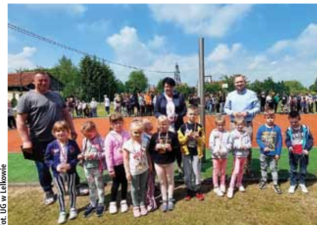
Inf. prasowa UG Lelkowo

W Szkole Podstawowej w Lelkowie odbyły się zawody sportowe z okazji Dnia Dziecka.