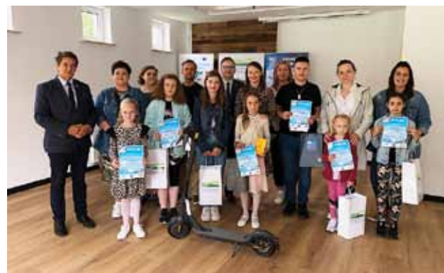
Uczestnicy konkursu „Zalew Wiślany moich marzeń”

W siedzibie Stowarzyszenia Lokalna Grupa Rybacka Zalew Wiślany w Braniewie odbyło się podsumowanie konkursu plastycznego „Zalew Wiślany moich marzeń”.