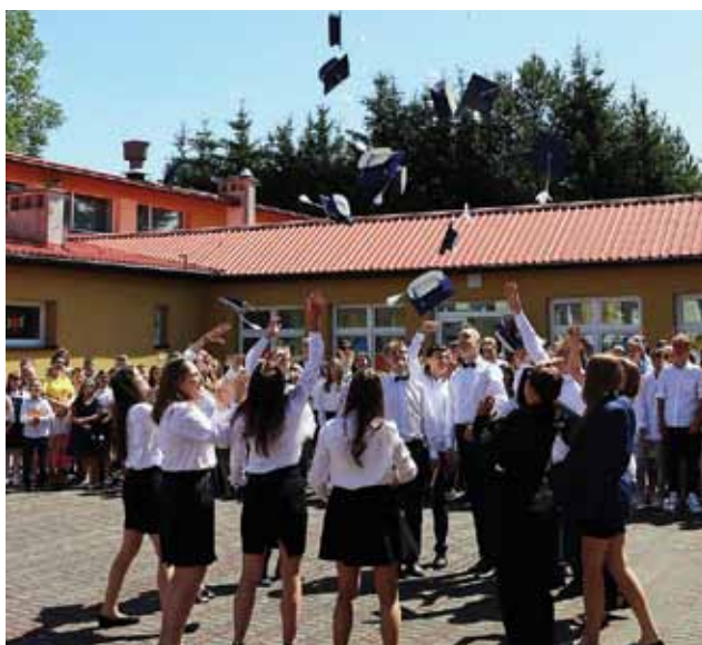
Ze szkołą pożegnała się kolejna grupa absolwentów