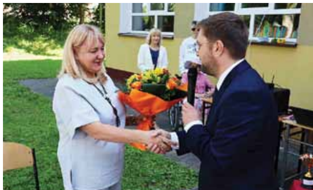
Zakończenie roku to także okazja do docenienia nauczycieli