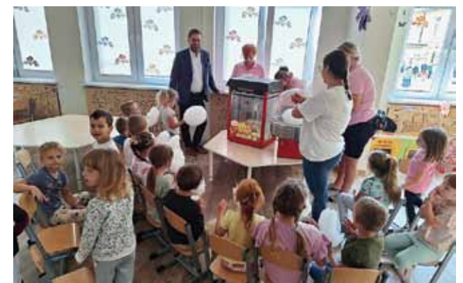
Wata cukrowa i popcorn – jedne z wielu atrakcji tego wyjątkowego dnia