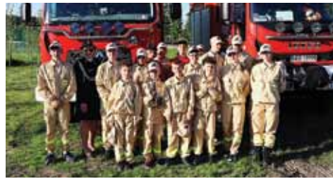
Młodzieżowa Drużyna Pożarnicza – to wśród nich są przyszli strażacy