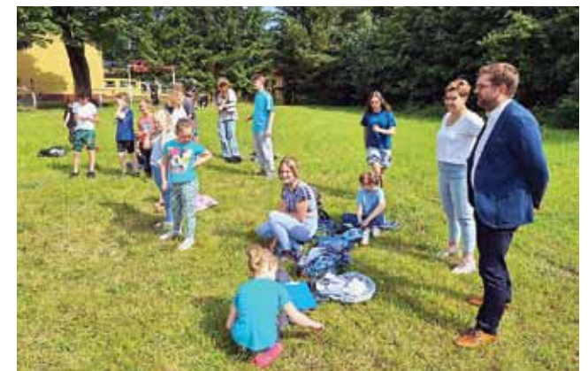
Nie zabrakło zabaw na świeżym powietrzu