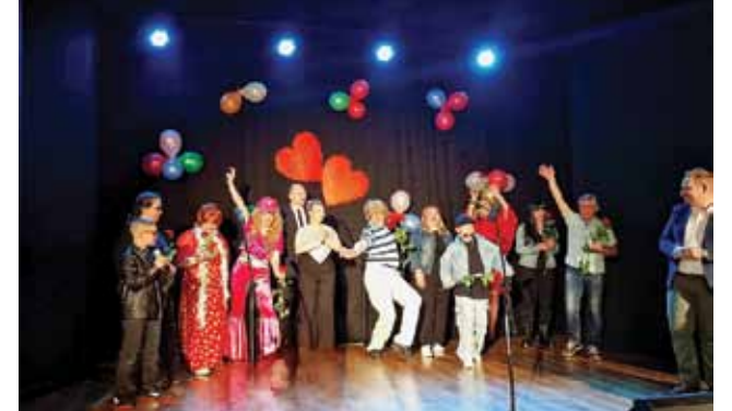
W występach zobaczyliśmy też dorosłych, którzy po raz kolejny wcieli się w znanych artystów

Podczas występów wyjazdowych w Gronówku odbył się konkurs „Mam Talent”, w którym wzięli udział aktorzy z sekcji teatralnej GCK. Zwycięzcy otrzymali puchary i wouchery do Term Warmińskich,