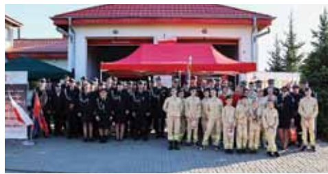
Dzień Strażaka – wspólne święto zarówno tych najstarszych druhów, jak i tych, którzy dopiero stawiają swoje pierwsze kroki