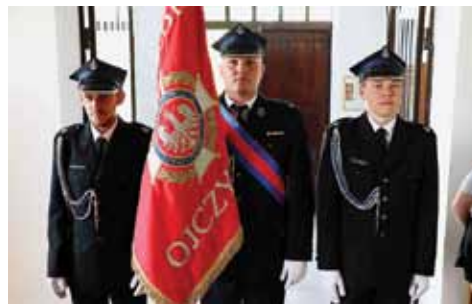
Strażacki poczet sztandarowy

Tuż po części oficjalnej odbył się rodzinny piknik strażacki, przygotowany przez Zarząd Oddziału Gminnego ZOSP RP w Braniewie,