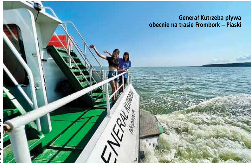
Generał Kutrzeba pływa obecnie na trasie Frombork – Piaski

Statek „Generał Kutrzeba” (pływający dotąd z Tolkmicka do Krynicy Morskiej) kursuje teraz z Fromborka do Piasków. Na razie we wszyst-