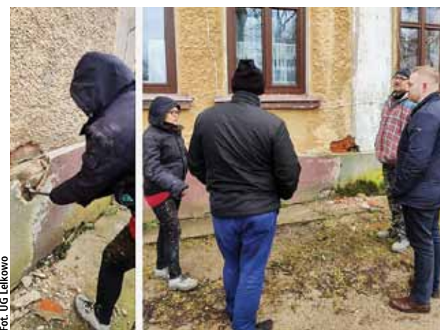
Spotkanie na miejscu planowanych prac remontowych w Dębowcu

Pracownia ARTHUR wykonuje dla Gminy Lelkowo usługę polegającą na badaniu konserwatorskim oraz przygotowaniu ekspertyzy i projektu w związku z remontem zabytkowego budynku w Dębowcu. To kolejne niezbędne dokumenty do rozpoczęcia prac.