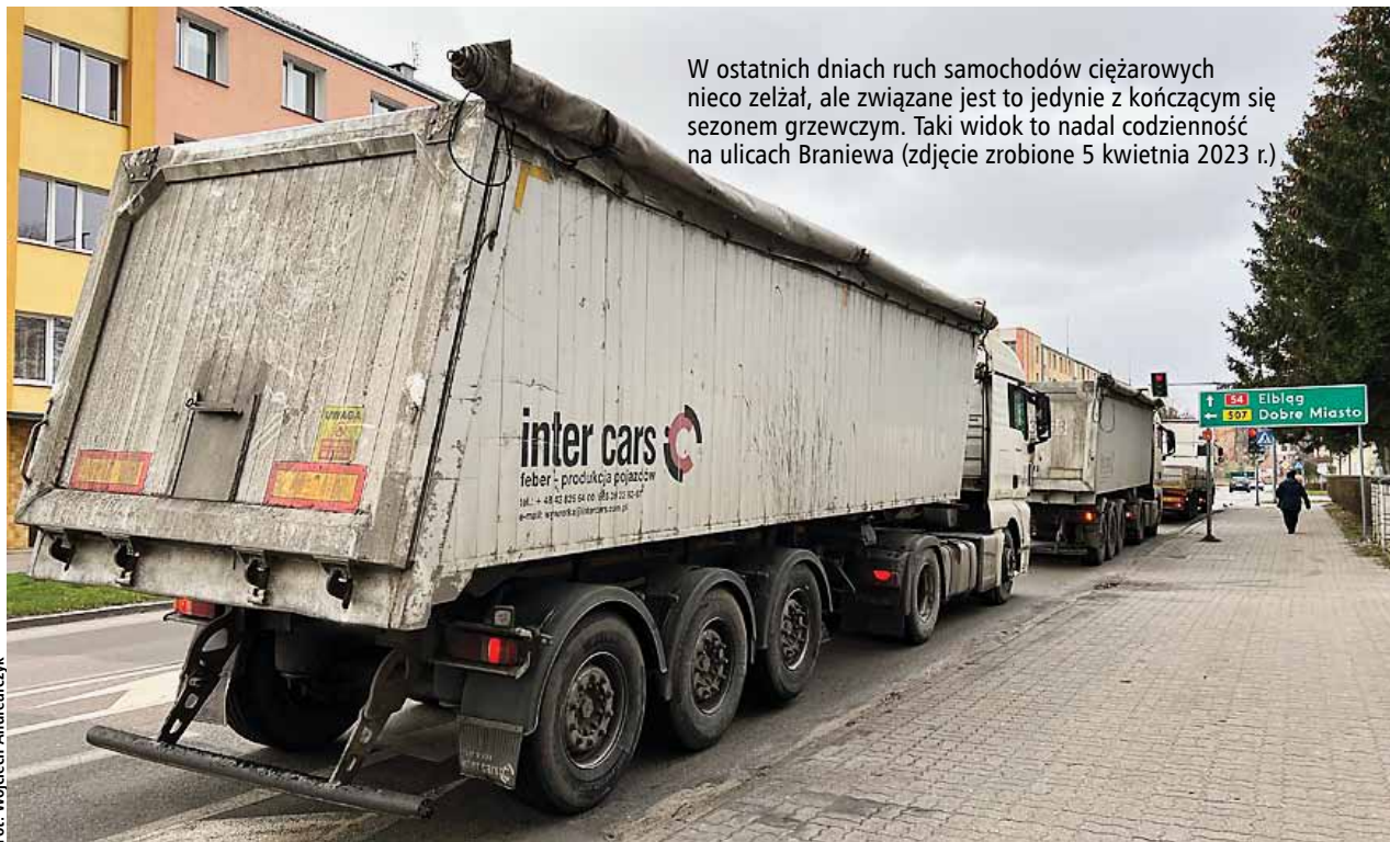
W ostatnich dniach ruch samochodów ciężarowych nieco zelżał, ale związane jest to jedynie z kończącym się sezonem grzewczym. Taki widok to nadal codzienność na ulicach Braniewa (zdjęcie zrobione 5 kwietnia 2023 r.)

W obiektach przylegających do dróg, którymi odbywa się transport, zauważalne są pęknięcia ścian, powstających w wyniku naprężeń spowodowanych przejazdem ciężkich pojazdów. W konsekwencji budynki – mieszkalne, użytecz-