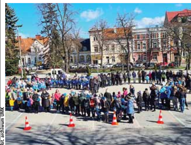
fol. archiwum UMK

W Kętrzynie obchody Światowego Dnia Świadomości Autyzmu miały przybliżyć postrzeganie świata i zachowań ludzkich przez osoby ze spektrum. To miał być, i był, wielki krok do zrozumienia, że każdy z nas jest inny i jednocześnie piękny.