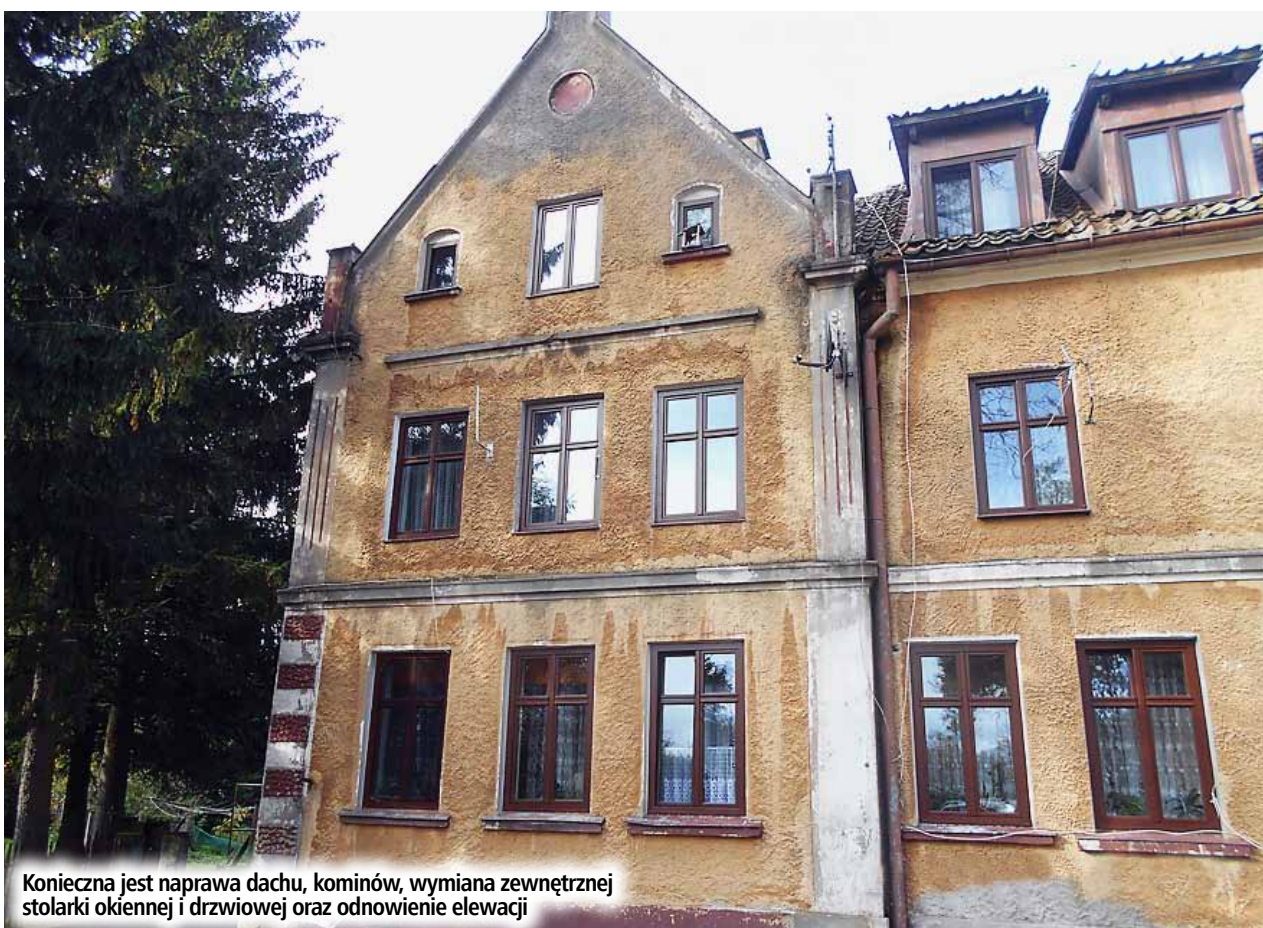
Konieczna jest naprawa dachu, kominów, wymiana zewnętrznej stolarki okiennej i drzwiowej oraz odnowienie elewacji

osoby starsze, schorwane, niepełnosprawne, korzystające w dużej mierze z pomocy gminnego ośrodka pomocy społecznej.