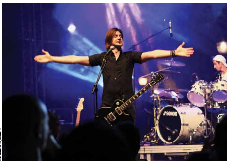
Nasz rozmówca podczas koncertu był zadowolony z reakcji publiczności