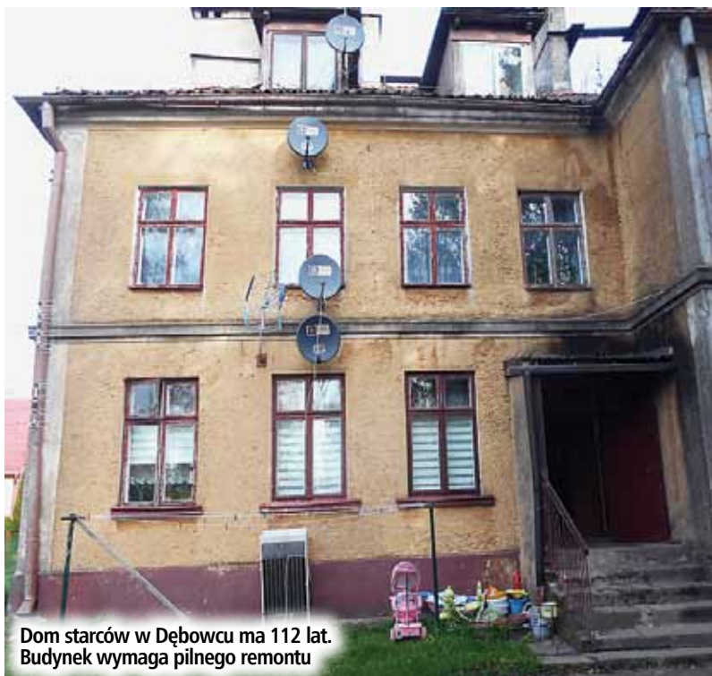
Dom starców w Dębowcu ma 112 lat. Budynek wymaga pilnego remontu

Obecnie budynek ten także nazywany jest „domem starców”, bowiem w 90 proc. zamieszkiwany jest przez byłych pracowników państwowych gospodarstw rolnych. Są to