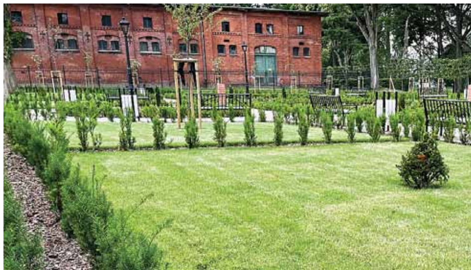
Nie zabrakło też trawników, ze starannie rozłożoną trawą; będzie można na nich rozłożyć koce i oddać się błógiemu spokojowi