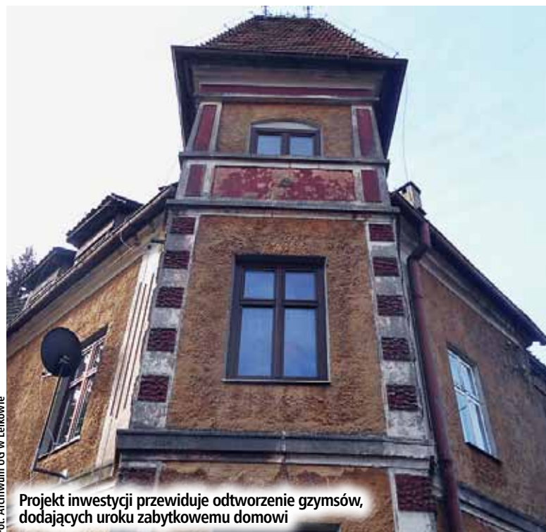
Projekt inwestycji przewiduje odtworzenie gzymsów, dodających uroku zabytkowemu domowi