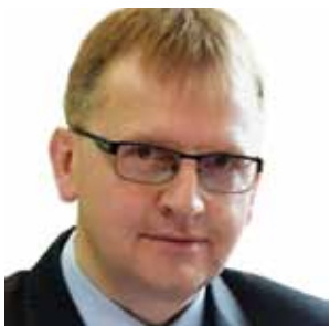
Radny Województwa Warmińsko-Mazurskiego

W ostatnim czasie znowu zaczęły do mnie spływać skargi przedsiębiorców na stosowany w Urzędzie Marszałkowskim tak zwany system „olimpijski”, który uzależnia możliwość weryfikacji warunków formalnych wniosków o pomoc finansową z funduszy Unii Europejskiej od szybkości wypełnienia aplikacji w wersji elektronicznej za pomocą systemu informatycznego.