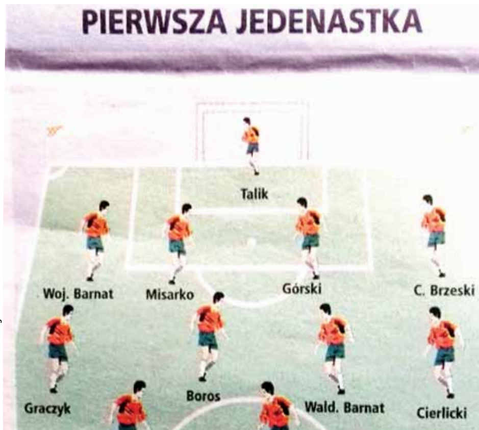
Propozycja ustawienia „Zatok” na pierwszy mecz rundy wiosennej wg. „Dziennika Bałtyckiego” z 7.03.1999 r.