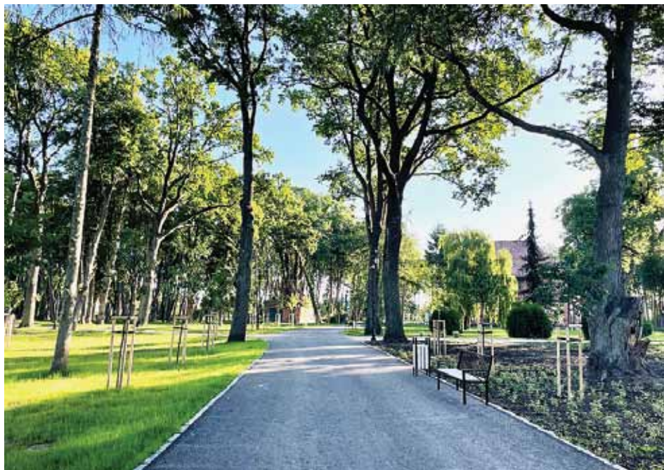
Wkraczając do parku na stadninie wchodzimy do zupełnie innego miejsca, niż znane nam dotychczas

Osobom odwiedzającym park na stadninie w Braniewie w pierwszej kolejności rzuca się w oczy nowa roślinność. Park zmienił swoje oblicze, rozjaśnił i wypiękniał.