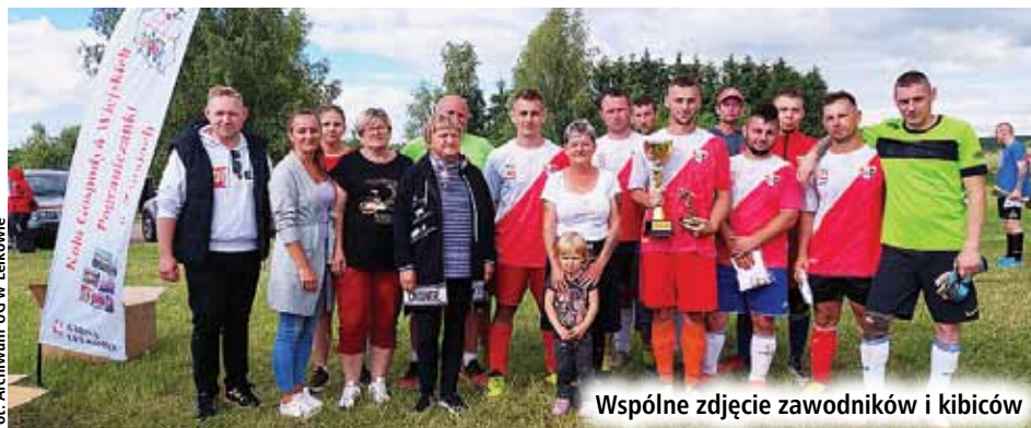
Wspólne zdjęcie zawodników i kibiców