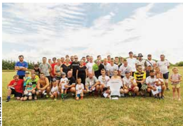
Turniej cieszył się dużym zainteresowaniem tak starszych...