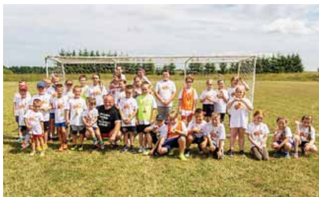
...jak i młodszych mieszkańców Gminy Lelkowo