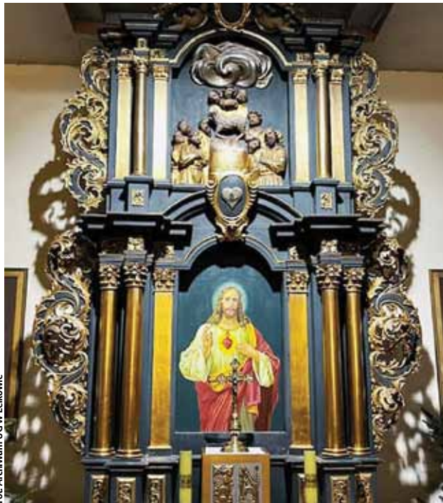
Ołtarz w kościele parafialnym w Dębowcu

Drugi z wniosków, na kwotę 640 tys. złotych, będzie przeznaczony na modernizację ulegającej degradacji elewacji Szkoły Podstawowej w Zagajach, która jest częścią dawnego Zespołu Dworsko-Parkowego.