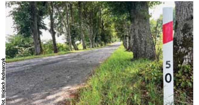
Odcinki drogi wojewódzkiej z Lelkowa do Głębocka są systematycznie remontowane od 2021 roku

Pierwszy odcinek, o długości 610 metrów, połączy dwa już istniejące fragmenty drogi, tworząc jednolitą i spójną trasę. Drugi odcinek, o długości 1050 metrów, zostanie wykonany od zjazdu do miejscowości Szarki, kierując podróżnych w stronę