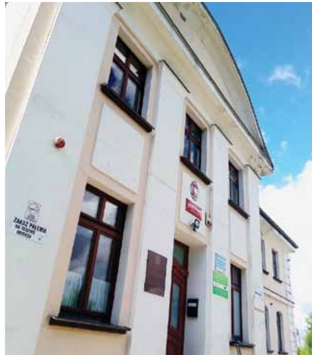
Budynek szkoły w Zagajach

— Dziękuję kierownik Referatu Rozwoju Gospodarczego